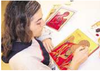
◆ Das „Schreiben“ einer Ikone ist wahre Kunst