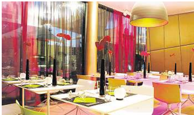
◆ roomz vereint guten Geschmack mit günstigem Preis

INFO: roomz graz, Conrad-von-Hötzendorf-Straße 96, 8010 Graz , Tel. (0316) 90 20 90, www.roomz-graz.com