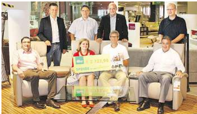
◆ Jede Spende ist wichtig: Leiner unterstützt das Hospiz Sterntalerhof seit Bestehen der Einrichtung

ALLE WEITEREN INFORMATIONEN: www.sterntalerhof.at